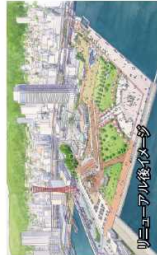
リニューアル後の様子

「みなと神戸」の顔として、芝生広場の整備や夜間景観の演出など、快適でにぎわいのある公園へのリニューアルに取り組みんでいます。(神戸開港150年記念事業)