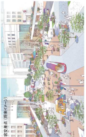
三宮交差点(将来イメージ)

「えきまちは空間」基本計画とは… 「えきまちは空間」の具体的な計画を示し、設計の基本となるマスタープランのことで、 ▶公共空間を中心とする全体の空間構成(施設の配置を含む) ▶空間要素のデザイン方針や景観形成方針 ▶地区交通計画 ▶公共空間の利活用・運営管理の仕組み