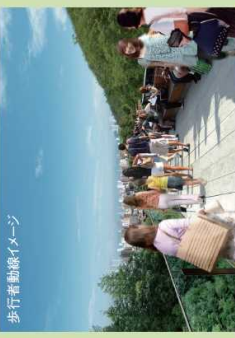
歩行者動線イメージ

神戸の広域的な玄関口の一つである新神戸駅と北野地区をつなぎ、神戸の街並みを楽しみながら巡れるようにする、新たな歩行者動線の検討に取り組んでいます。