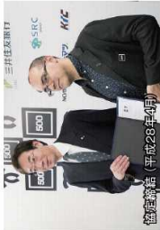
協賛講話 平成28年10月

500 Startupsとは... シリコンバレーにある世界トップレベルのスタートアップ育成支援団体であり、世界50か国1500社以上に投資しています。日本での育成プログラムは神戸でしか行われていません。