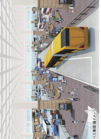
バス乗降場イメージ