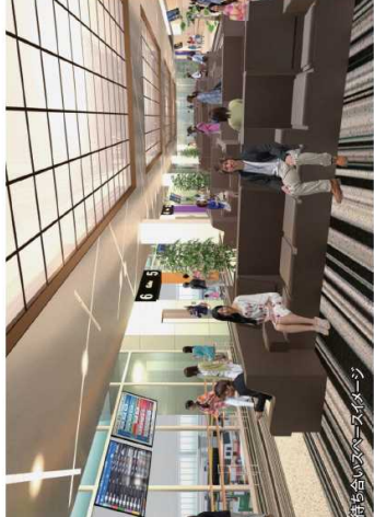
待ち合いスペースイメージ