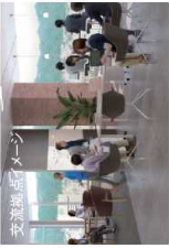
交流拠点イメージ

医療関連を含む神戸の地場企業やIT関連企業、大学、研究機関など、産学官が参画・連携し神戸の産業にイノベーションを起こすことを目指し、知的交流拠点の整備に取り組んでいます。