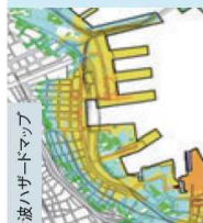
津波ハザードマップ

南海トラフ巨大地震に伴う津波対策として、浸水深を人命に影響を与えないとされる30cm未満に抑えるため、防潮堤等の補強に取り組みんでいます。