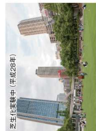
芝生化実験中(平成28年)

都心の貴重なオアンプレンスペースである東遊園地を、グラウン・ドの芝生化やにぎわい創出事業などの社会実験を通して、都心の活性化や回遊性向上の拠点として、リノベーションに取り組んでいます。