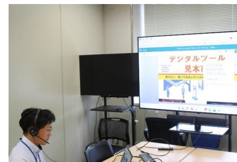
県庁内オンラインセミナーの講師を務める市町研修生