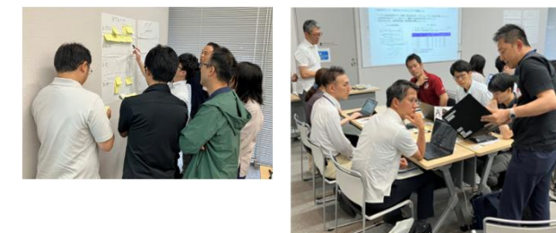
コスト最適化ワークショップの様子

デジタル庁のコスト精査などの支援や研修、共創プラットフォームに積極参画し、国、県、市町が一体で推進