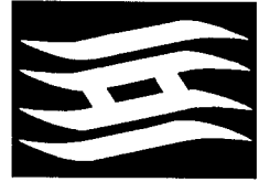
(兵庫県民の旗=県旗)