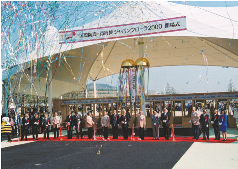
国際園芸・造園博「ジャパンフローラ 2000」開催（平成 12 年）