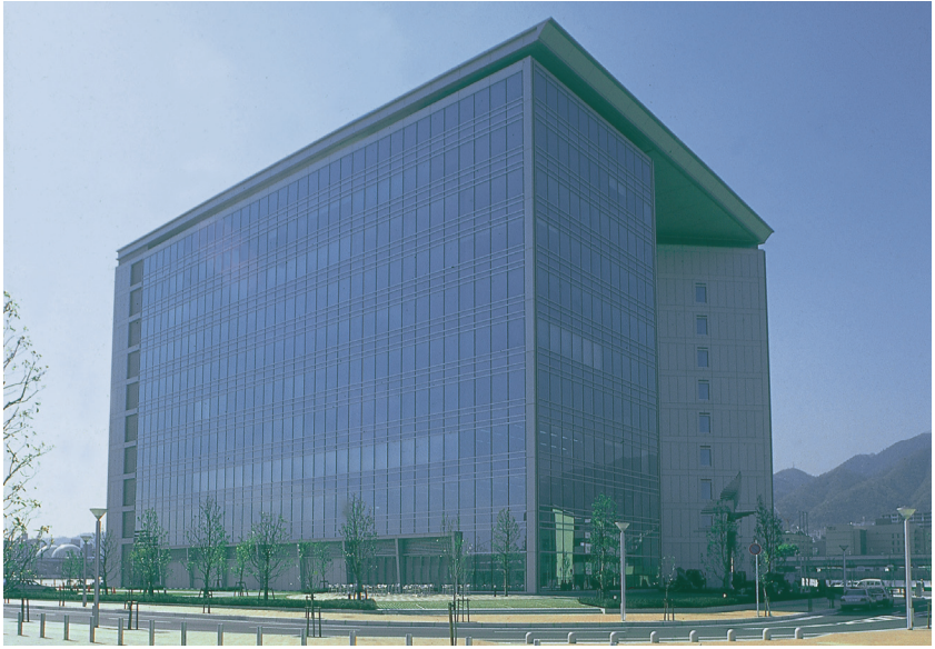
WHO 神戸センター発足 (平成 8 年)