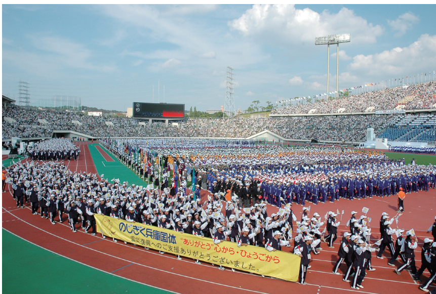
震災復興支援への感謝を伝えた「のじぎく兵庫国体」（平成 18 年）