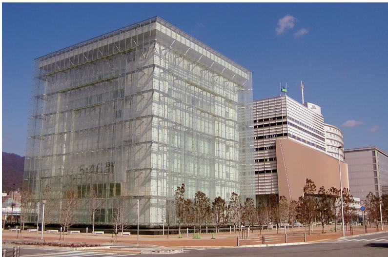
阪神・淡路大震災記念 人と防災未来センター開館

※左：防災未来館（現西館、平成 14 年 4 月開館） 右：ひと未来館（現東館、平成 15 年 4 月開館）