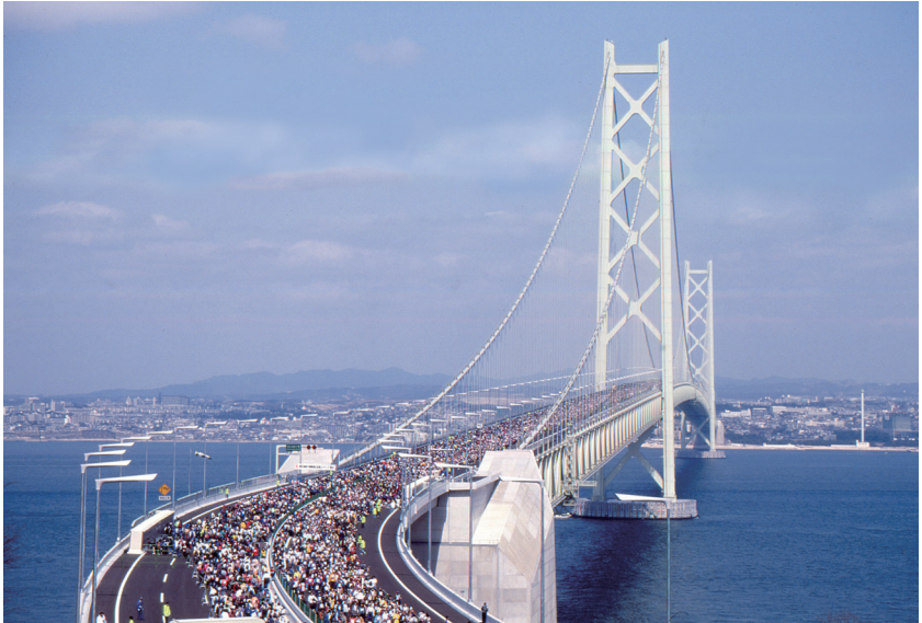
明石海峡大橋完成 (平成 10 年)