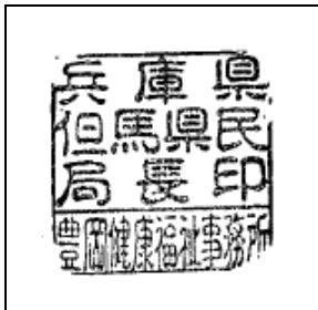
兵庫県但馬県民局長印 (豊岡健康福祉事務所)