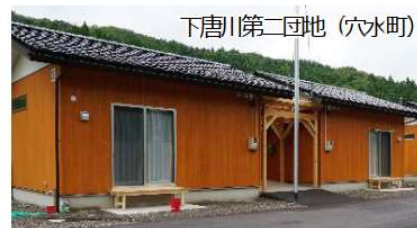
下唐川第二団地(穴水町) 木造戸建て風(ふるさと回帰型) 33戸

○豪雨により浸水被害が確認された仮設住宅は、 全戸の修繕を本日完了 →床上浸水6団地(218戸)等