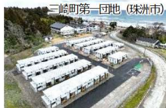
三崎町第一団地(珠洲市) プレハブ(従来型) 5,565戸