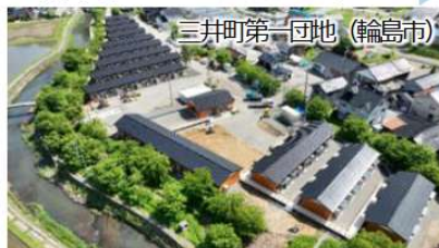
三井町第一団地(輪島市) 木造長屋(まちづくり型) 1,570戸