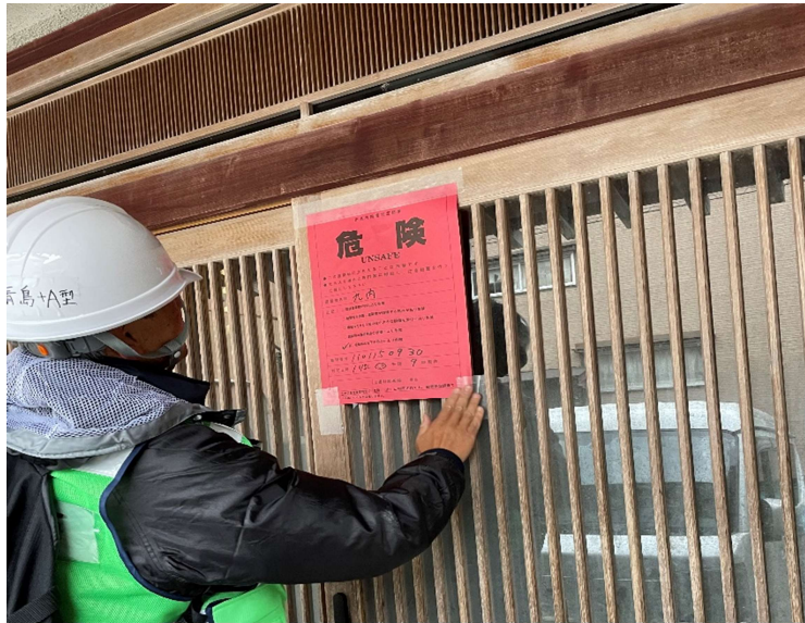
倒壊家屋の応急危険度判定業務(輪島市)