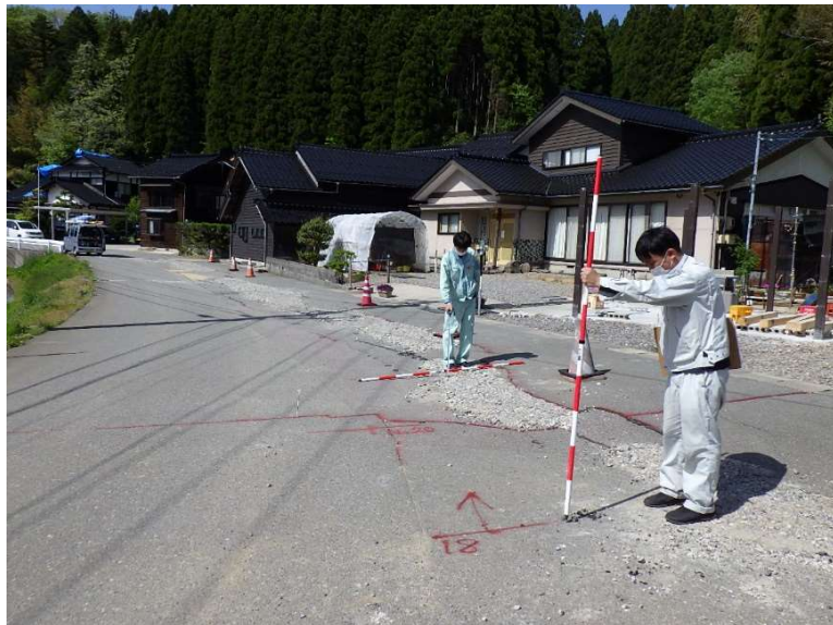
土木復旧業務(志賀町)