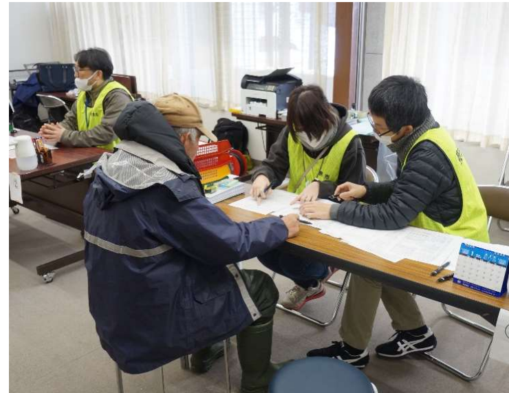
応急仮設住宅受付(穴水町)