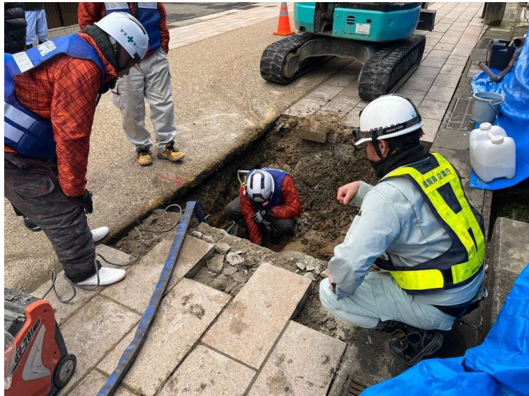
上水道復旧支援(能登町)