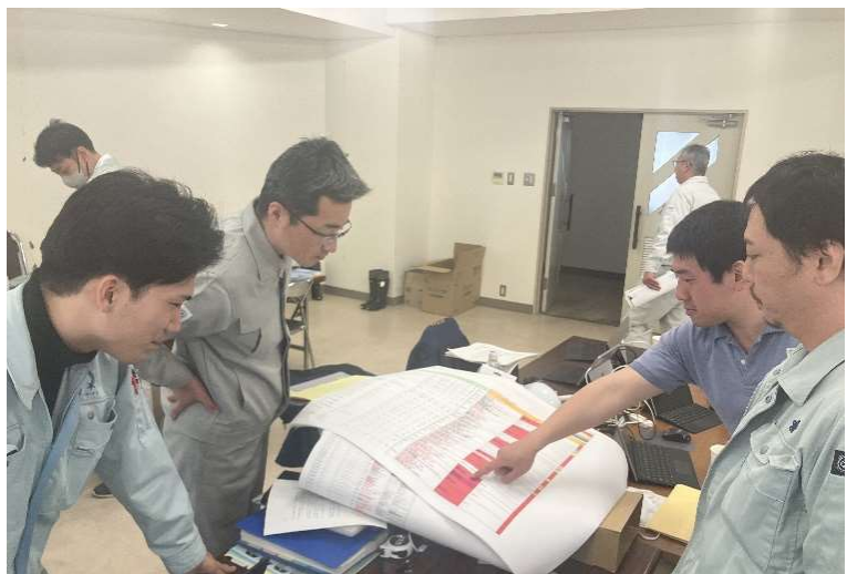
橋梁災害復旧工事の設計(珠洲市)