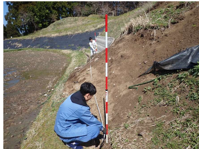
農業用施設の災害復旧(輪島市)