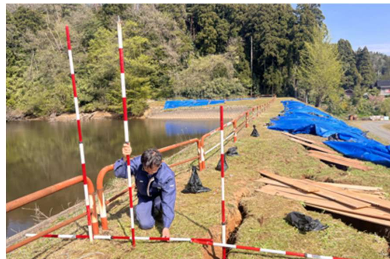
ため池復旧工事測量(珠洲市)