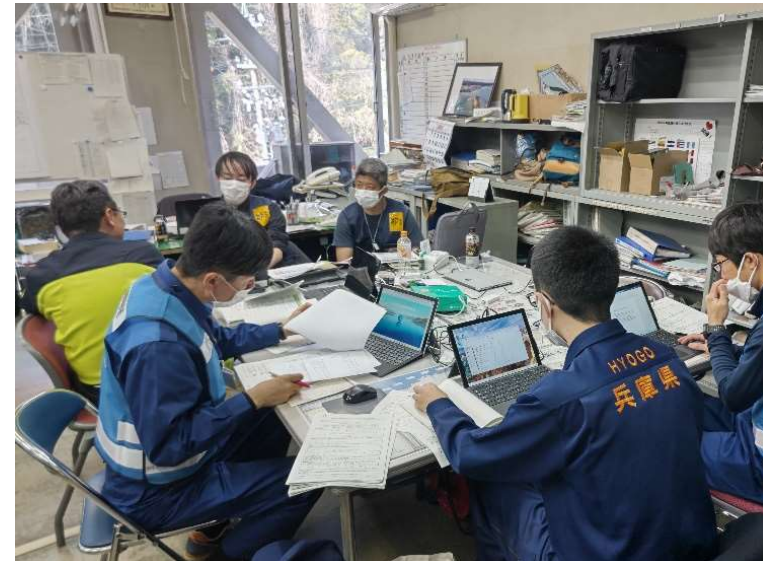
義援金申請書類の確認作業(珠洲市)