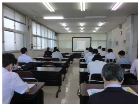
【策定講座(ステップ2)受講風景】