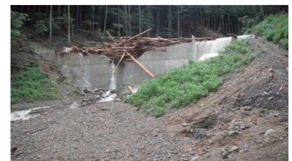
【流木を補足した治山ダム(丹波市)】