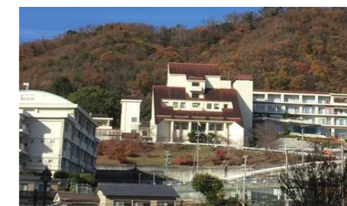
【ひょうごこころの医療センター(指定予定)】