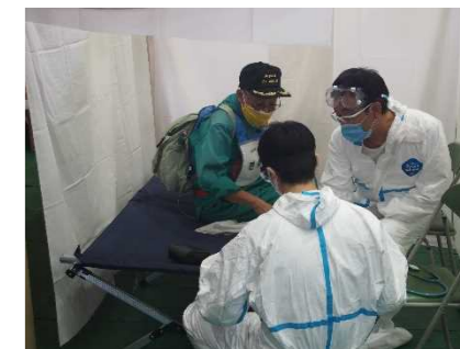
【体調不良者を隔離対応する訓練】