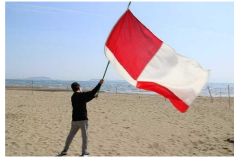
【県内初の津波フラッグの導入(たつの市)】