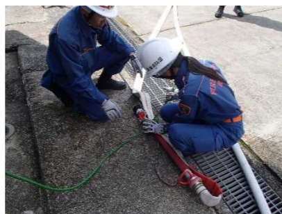
【女性消防団による訓練の様子】