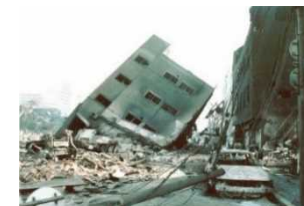
阪神・淡路大震災（H7）