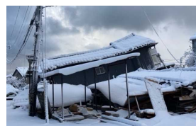
能登半島地震（R6） 新潟県中越地震（H16）