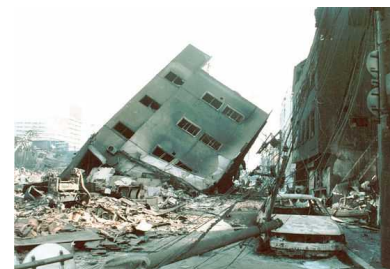
阪神・淡路大震災（H7）