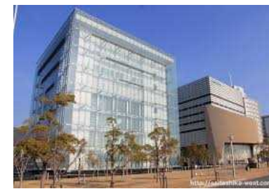
人と防災未来センター