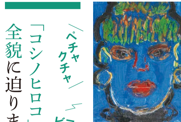
コシノヒロコ (WORK#1615) 2016年