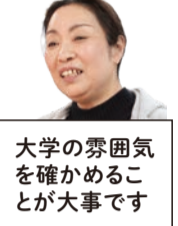
大学の雰囲気確かめることが大事です