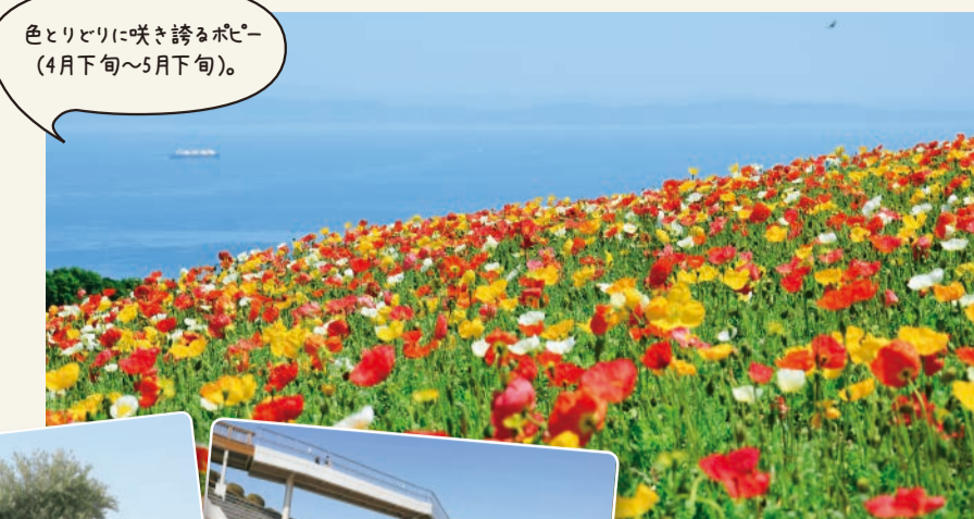
色とりどりに咲き誇るポピー(4月下旬~5月下旬)。

淡路市楠本2805-7 9時~17時(最終入園は16時30分) 年末年始 0799(74)6426 0799(74)6428