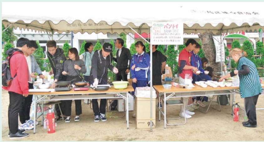
毎年10月の「多文化フェスティバル深江」は10回以上を数え、地域の恒例行事として定着しています(写真は令和元年)。