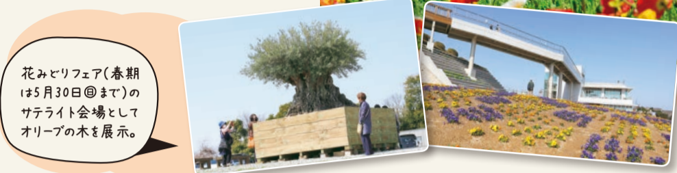
花みどりフェア(春期は5月30日@まで)のサテライト会場としてオリブの木も展示。