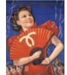
ポスター(神戸みなとの祭)1936年 兵庫県立歴史博物館蔵(入江レクノン)