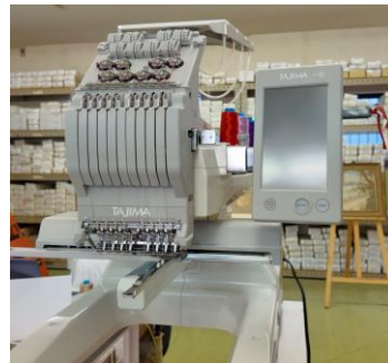
▲移動式の刺繍ミシン（金川刺繍）