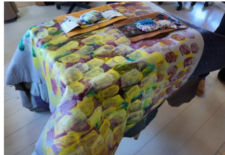
▲障がい者のアート作品