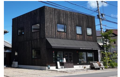
▲体験店舗の一つ「革の森」