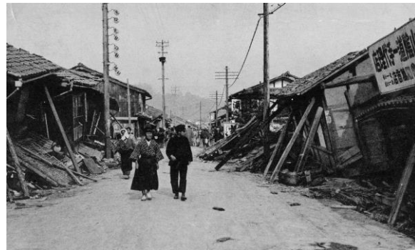
▲豊岡駅前の倒壊した家屋