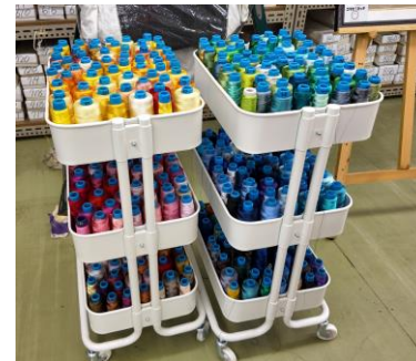
▲カラフルな糸（金川刺繍）