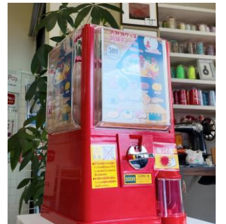
▲コラボ製品のガチャも