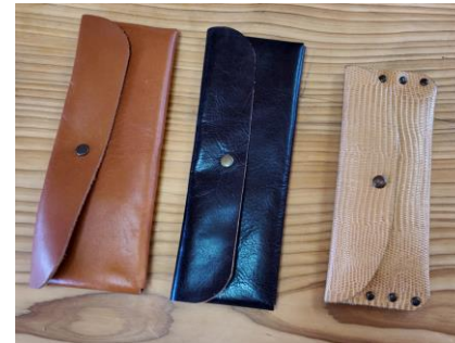
▲制作したペンケース