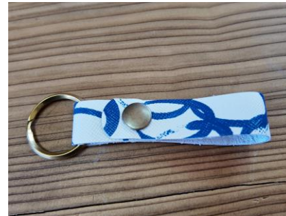
▲唯一無二のキーホルダー