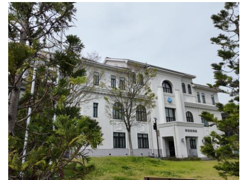
▲豊岡稽古堂（旧豊岡町役場庁舎）