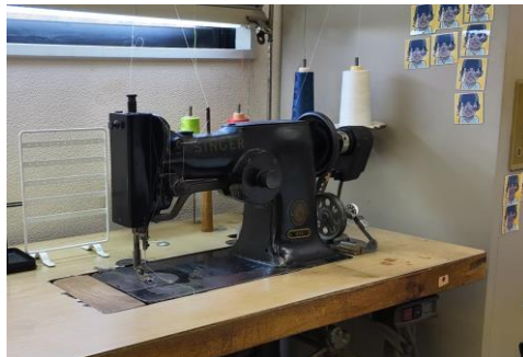
▲古くから使われているミシン（金川刺繍）