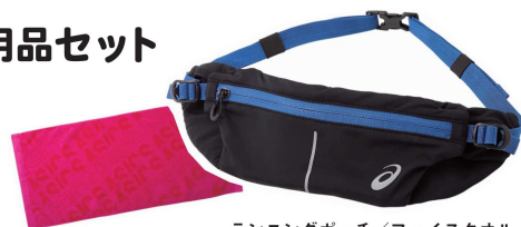
ランニングポーチ/フェイスタオル