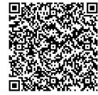
申込用二次元コード

問い合わせ先 兵庫県神戸県民センター 県民躍動室県民課 TEL : 078-647-9094 Eメール : kobe_kem@pref.hyogo.lg.jp