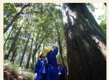
【摩耶山天然スギの巨木】

兵庫署管内には生物多様性保全に配慮した保護林が10箇所あり、「摩耶山天然スギ希少個体群保護林」もその一つです。