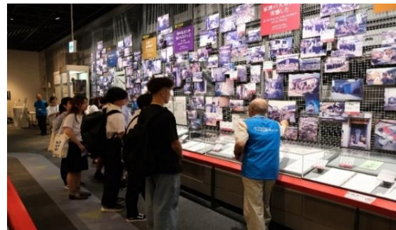
人と防災未来センター（フィールドパビリオン体験）