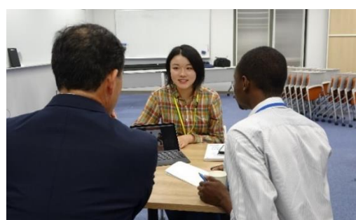
ご寄附をいただいた企業の皆様、アドバイザー等と高校生の交流会