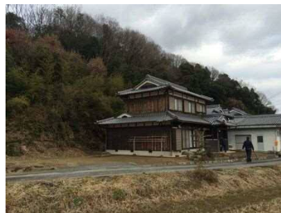
③保全対象とがけの状況