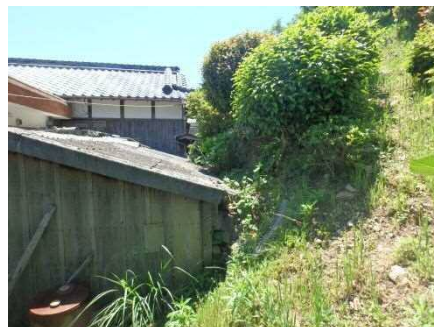
③保全対象とがけの状況