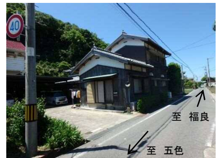
④保全対象(人家・主阿万福良湊線)