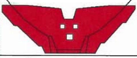
えん堤工 H=9.0m, L=50.0m