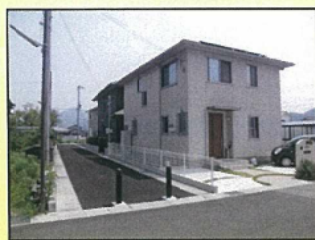
区画道路整備状況