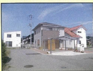
新築住宅立地状況