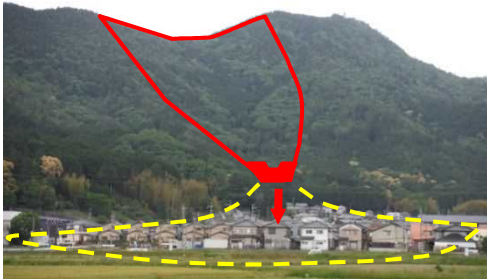
保全対象人家(谷出口より)