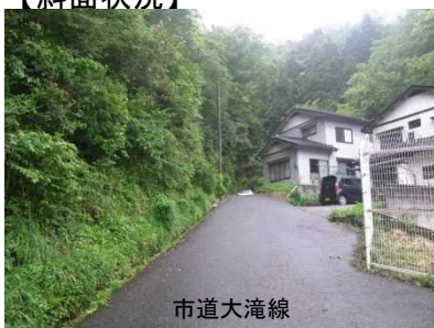
①保全対象とがけの状況