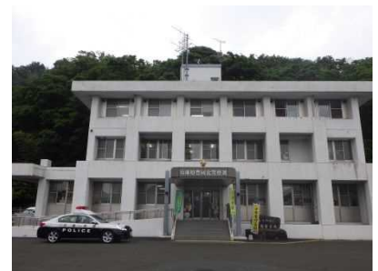
③保全対象(豊岡北警察署)