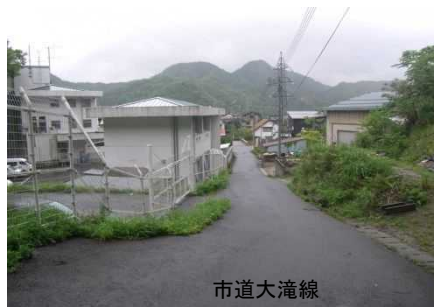
②保全対象(市道大滝線)