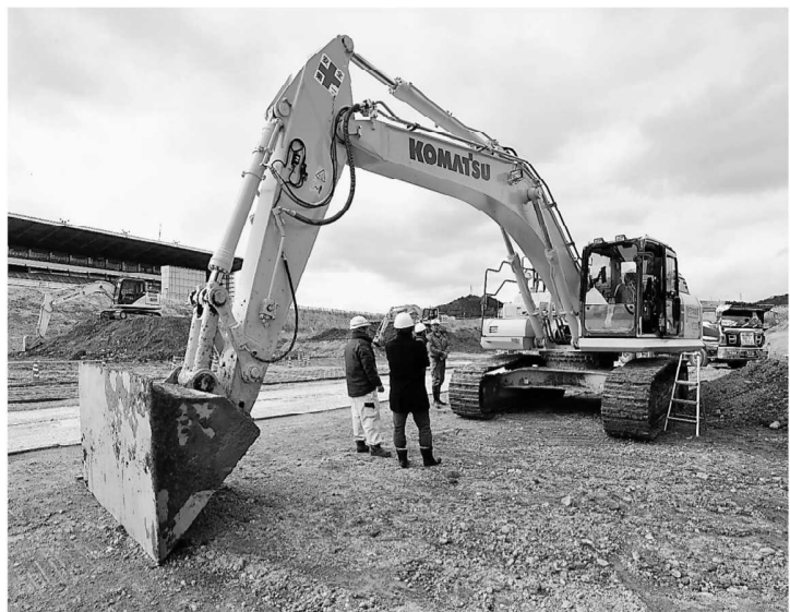
ICT機器が装着されている建設機械。3次元設計データをもとに正確に掘削したり地面をならしたりすることができる

モニター中央を確認しながら作業する重機オペレーター。オペレーターに指示を出す補助員配置の必要がなくなった