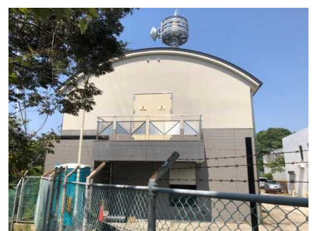
④保全対象(配水場施設)