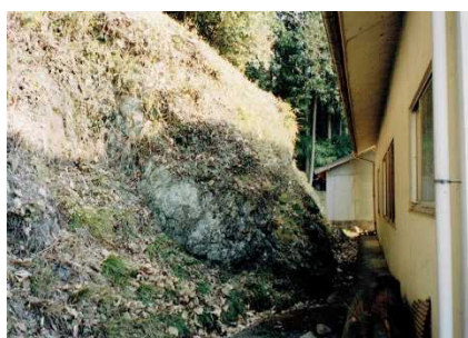
③保安対象とがけの状況