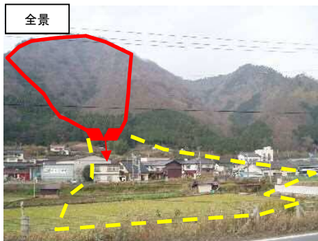
流域面積 A=0.1km 2 事業内容 (全 体) えん堤1基