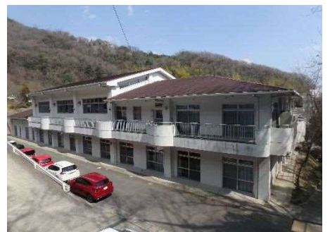
④保全対象(老人福祉施設(西はりまナーシングウイ))