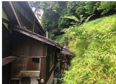
③斜面(人家裏)及び保全対象の状況