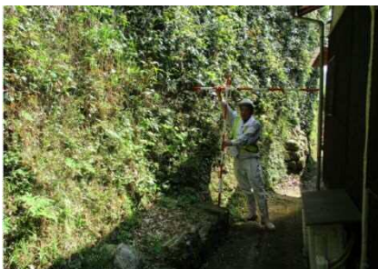
②斜面(人家裏)及び保全対象の状況