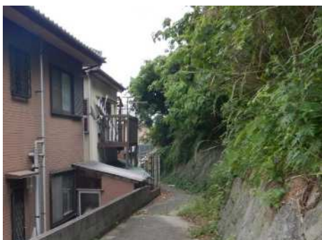
② 保全対象とがけの状況