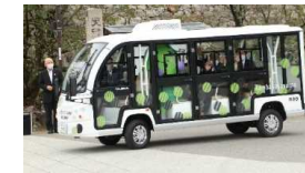
「meGREEN(めぐりん)」の本格運行