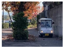
自転車歩行者道を走行する様子

(注1) R2計画改定以前に網形成計画が策定済市町は、基準値にて計上 (注2) 計上漏れがあったため数値を更新しています (注3) 網形成計画策定済