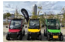
超小型モビリティ「BIRO」