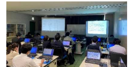
標準的なバス情報フォーマット(GTSF-JP)更新演習（11/28）