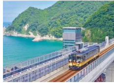
観光列車うみやまむすび