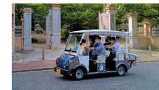
グリーンローモビリティ試乗会（7/11）