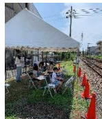
写生大会in北条鉄道