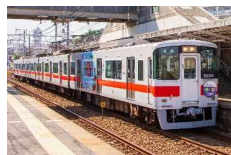
山陽電車「豊かな海づくり号」(ラッピング電車)