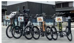
電動アシスト三輪自転車