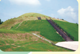
#茶すり山古墳公園・学習館

茶すり山古墳公園・学習館 ▶北東へ4km 休 月曜日 TEL 9:00～17:00 ¥ 無料 近畿地方最大規模の円墳である史跡茶すり山古墳。頂上に埴輪の復元レプリカが並び眺望も最高。