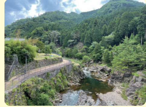
#市川沿いのトロッコ軌道跡