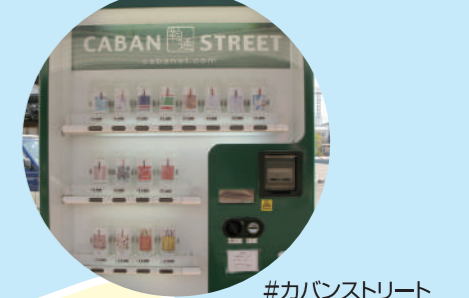
#カバンストリート

カバンストリート ▶東へ1km 「カバンのまち」豊岡の豊岡鞆やオリジナルデザインの鞆などのショップが並んでいます。