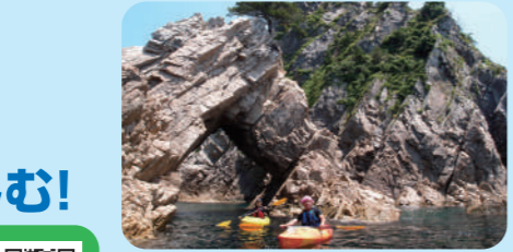
#岩美町立渚交流館 シュノーケリング&シーカヤック