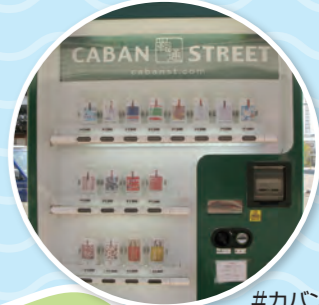
#カバンストリート

「カバンのまち」豊岡の豊岡鞆やオリジナルデザインの鞆などのショップが並んでいます。