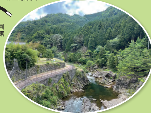
#市川沿いのトロッコ軌道跡