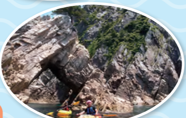
#岩美町立渚交流館 シュノーケリング&シーカヤック