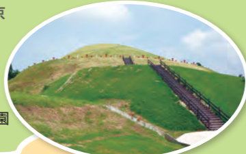
#茶すり山古墳公園・学習館