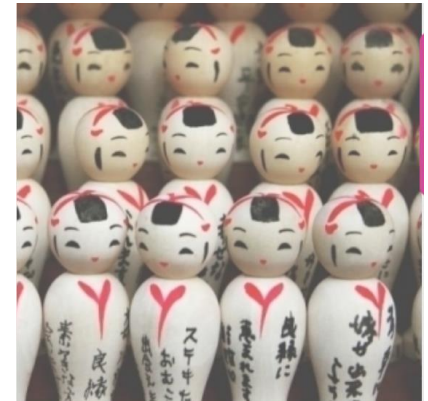
2018.02.11 外国人にも人気！？SNS No.1東北人気スポット「松島」<パワースポ.>