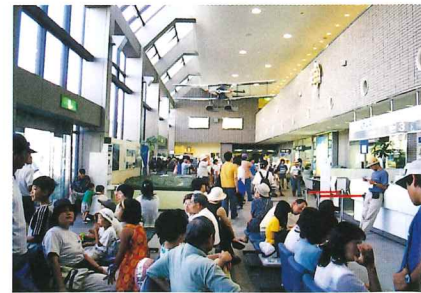
ロビー・チェックインカウンター