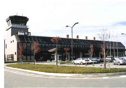
ターミナルビル 鉄骨2階建て。駐車場は58台収容。会議室、特別会議室も設けています。(延べ床面積2,255m 2 )