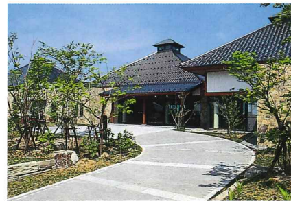
レストラン 滋味あふれる但馬の味に舌鼓。眼下には美しい山並みと豊岡の市街地が広がります。