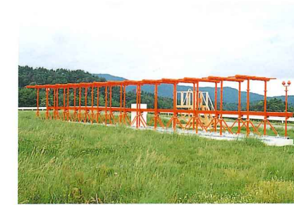
航空保安無線施設(LLZ/T-DME) 誘導電波により、航空機の着陸を援助します。