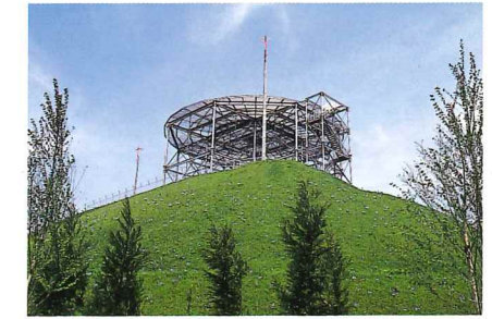
航空保安無線施設(VOR/DME) R3.3.25無線廃止 コウノトリ但馬空港で離発着する航空機に、空港の方位や空港までの距離を知らせます。