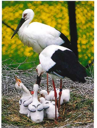
国の特別天然記念物「コウノトリ」