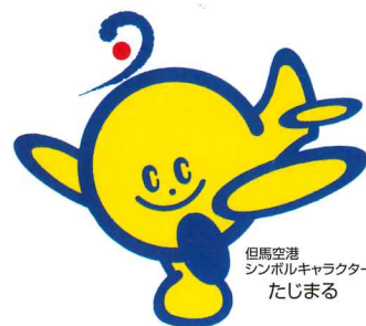
但馬空港 シンボルキャラクター たじまる

平成11年に「兵庫県立コウノトリの郷公園」が開園され、将来の野生復帰に向けた調査研究が進められている。野生復帰は人と自然が共存できる地域環境づくりの取り組みでもあり、コウノトリは空港周辺地域の豊かな自然の象徴である。