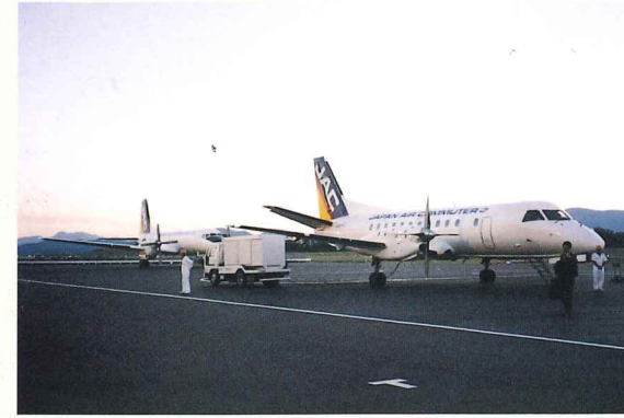
エプロン 手前 サブ340B、奥 YS-11