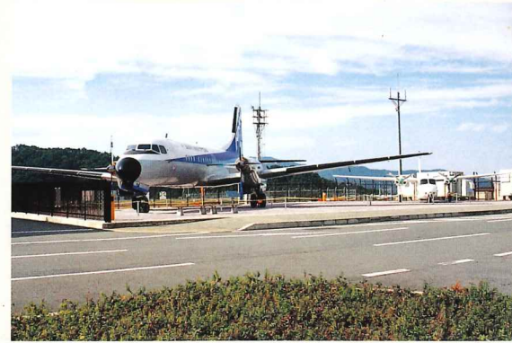
航空機展示場 退役したYS-11とエアロコマンダーを常設展示しています。