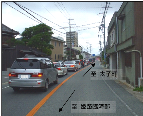
坂越橋西詰交差点(赤穂市) 国道 250 号