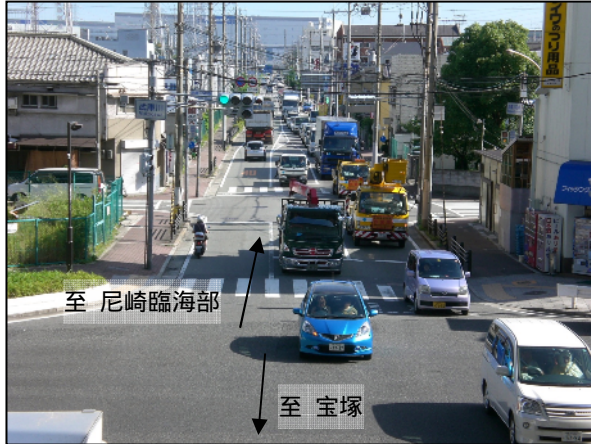
相生橋西詰交差点(高砂市) 県道明石高砂線