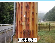
【橋脚巻立て鋼板の腐食】