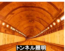
【蛍光灯の生産終了】