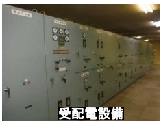
【設備の耐用年数超過】