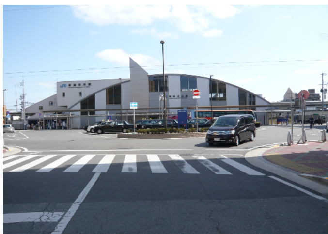
整備された駅前広場

また、南北自由通路においては、駅利用者だけでなく、市街地を南北に往来する歩行者も多くあり、市街地の一体化に寄与している。