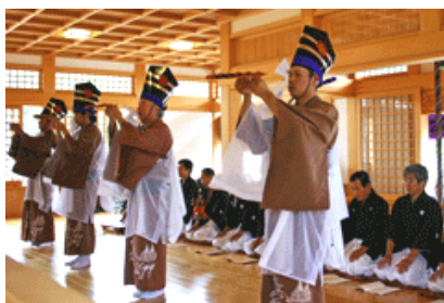
阿万の風流大踊小踊

※3 上流に作られた親池から取り決められた水利慣行に従って、必要に応じて下流に作られた子池に、さらにはその下流にある孫池へと水が供給される手法。