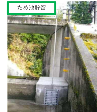
奥山池（新温泉町）等