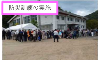
防災訓練の実施 新温泉町等