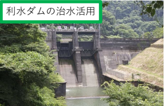
入江ダム（関西電力）等

※当該地域の推進計画には円山川水系が含まれるが、国が円山川流域治水プロジェクトを策定しているため、本プロジェクトに円山川水系は含まない。