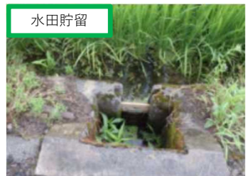
水田貯留（新温泉町）等