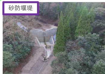
赤崎川砂防堰堤（新温泉町）