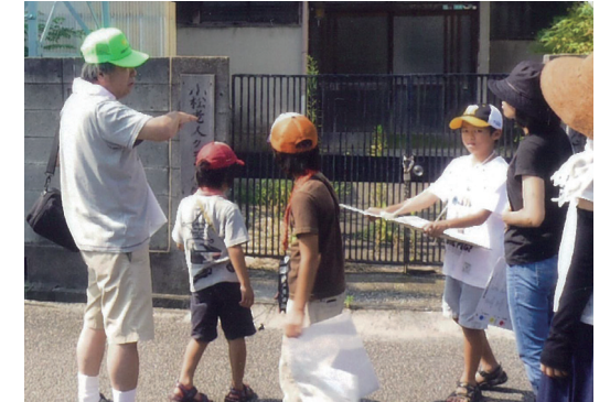
まち歩きの様子(西宮市小松地区)