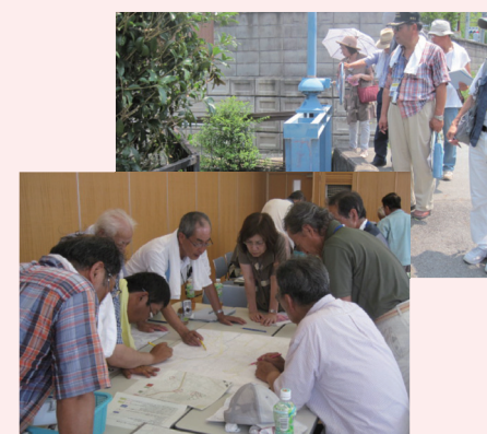
まち歩き・マップ作成状況(三輪区)