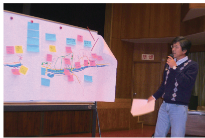
発表の様子(佐用町・徳久地域)