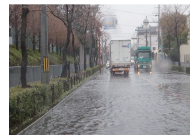
浸水被害(H24年尼崎市)