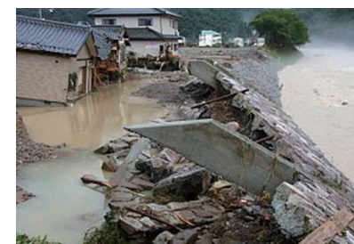
洪水被害(H21年佐用町)