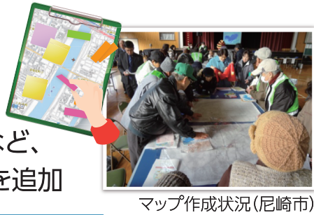
マップ作成状況(尼崎市)