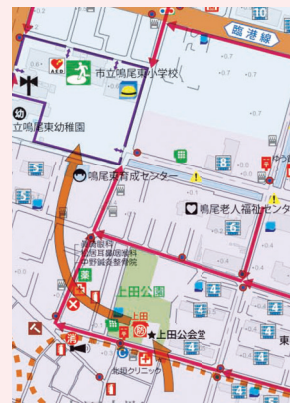
鳴尾東防災マップ

例) 地盤高を詳細に記載すること、 浸水ラインを写真に表示すること、 浸水時に蓋が外れる恐れのある マンホールの写真掲載、 3階建て以上の堅牢な建物、 津波による浸水予想区域 など