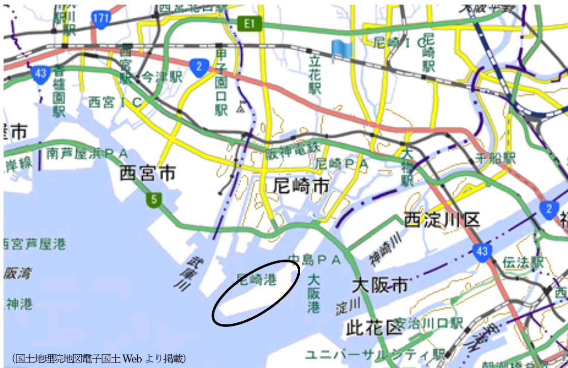
(国土地理院地図電子国土Webより掲載)