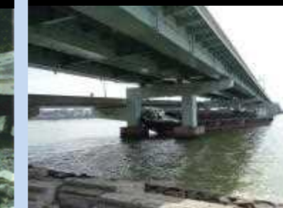
⑩船舶の衝突（県道橋 橋桁損壊）