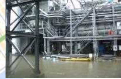
⑮ふ頭施設被害（資材置き場）