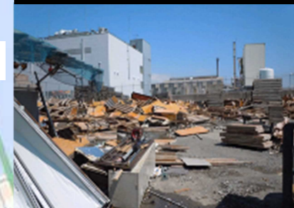
⑮ふ頭施設被害（資材置き場）