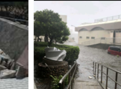
⑫施設被害（枝川浄化センター）