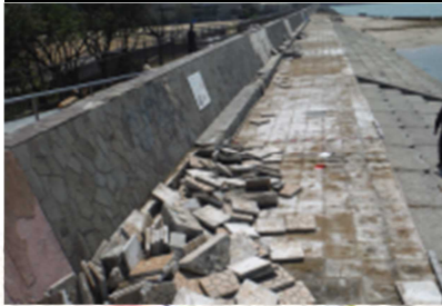
①護岸破損（チャンネルパーク）