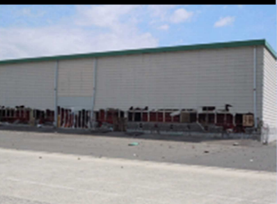
⑧ふ頭施設被害（上屋）