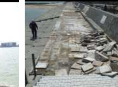
⑪護岸破損（甲子園浜）