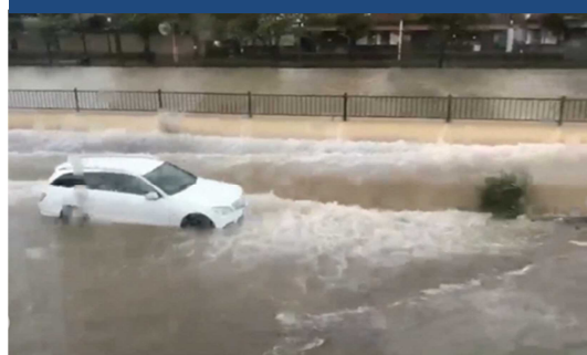
③浸水箇所（南芦屋浜）