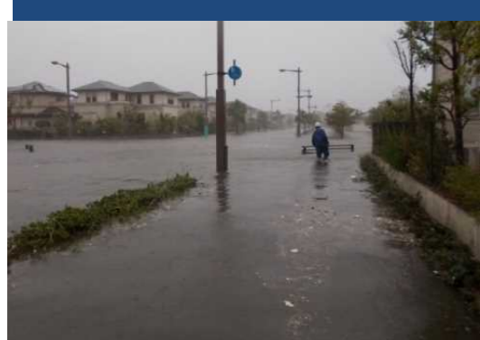
④浸水映像（南芦屋浜）