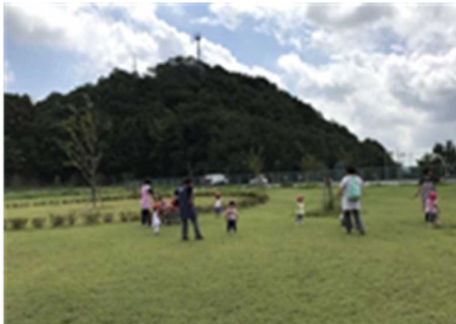
地域住民の交流広場を芝生化(神戸市)