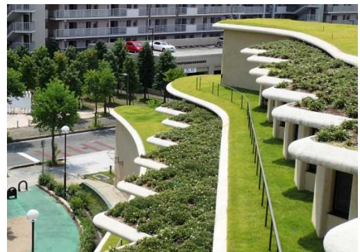
ガザニアによる屋上緑化(芦屋市)