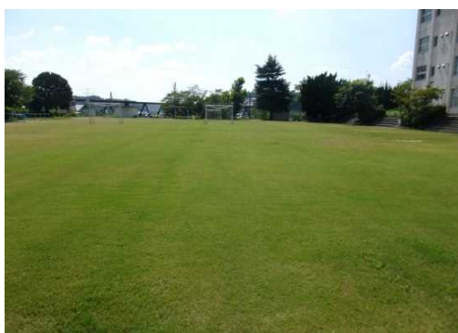
芝生化された小学校のグラウンド(三田市)