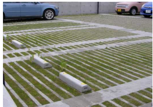
歩行性に配慮した芝生化駐車場(太子町)