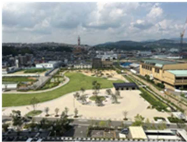
まちなかに里山の風景を再現 (川西市)