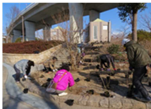
地域住民による植栽活動(神戸市)