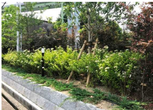
沿道をセットバック緑化 (尼崎市)