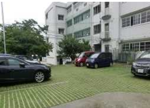
小学校内の駐車場の芝生化(西宮市)