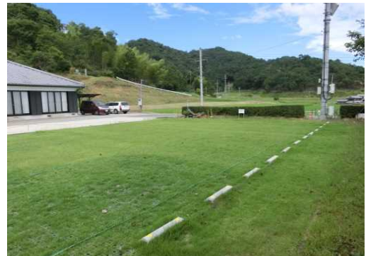
グラスチックマット型の芝生化駐車場(加西市)