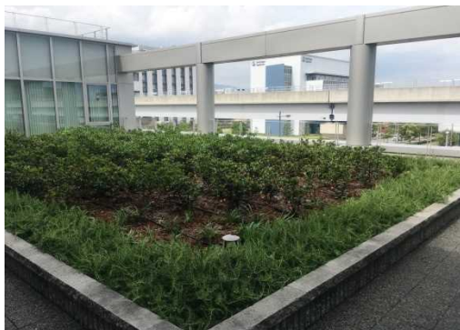
法人社屋の屋上緑化(神戸市)