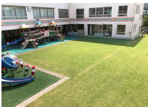
芝生化された幼稚園の園庭(神戸市)