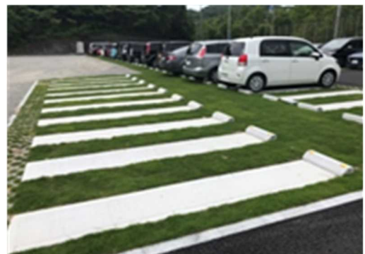
<整備後>コンクリートブロックで補強した芝生化駐車場(福岡町)