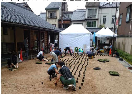
<整備前>地域住民が公園に芝生を植栽