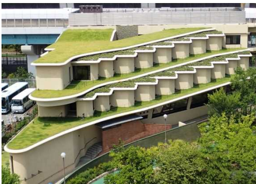
芝生による屋上緑化(芦屋市)