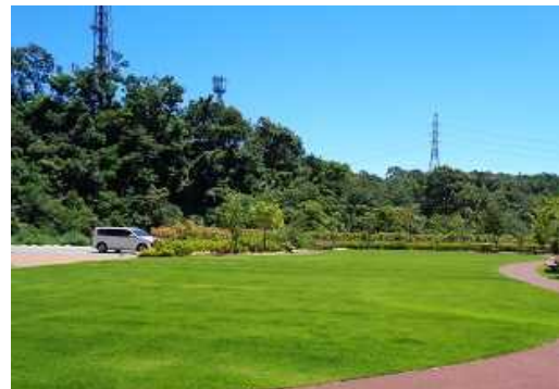
高齢者福祉施設の広場を芝生化(神戸市)