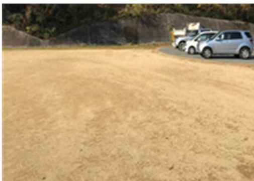
<整備前>未舗装の駐車場