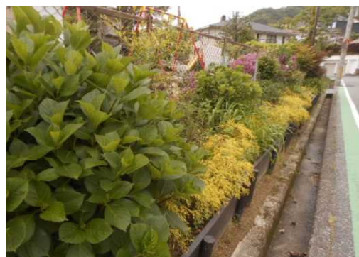
<整備後>花壇を再整備(西宮市)