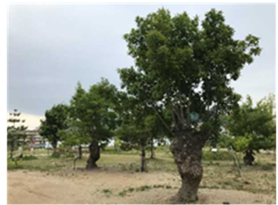
里山より台場クサギを移植 (川西市)