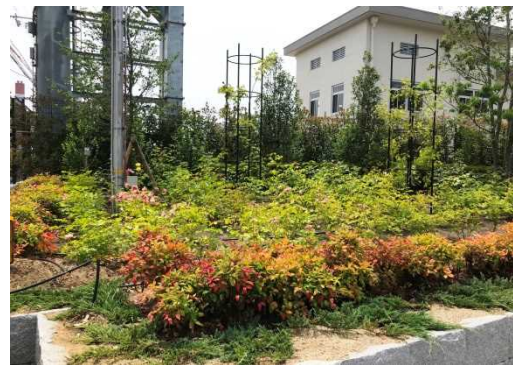
バラや季節毎に花が咲く樹種を植栽 (尼崎市)