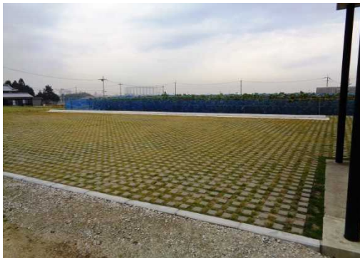
コンクリートブロック型の芝生化駐車場(神戸市)