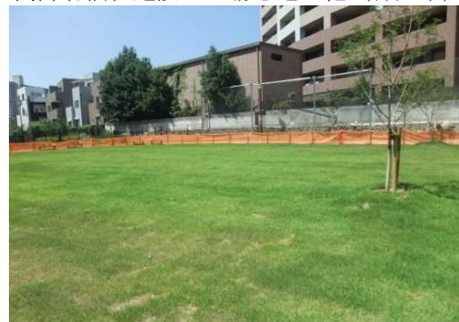
地域の公園を芝生化(宝塚市)