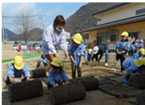
園児たちによる芝張り(西脇市)