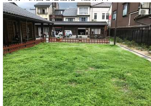
<整備後>芝生化された子育て広場(豊岡市)