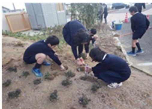
小学校内で生徒たちが植栽(明石市)