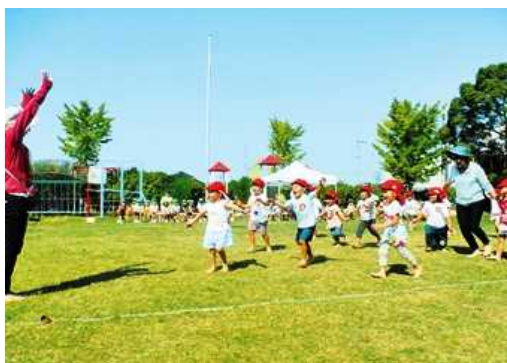
芝生化された保育園の園庭(神戸市)