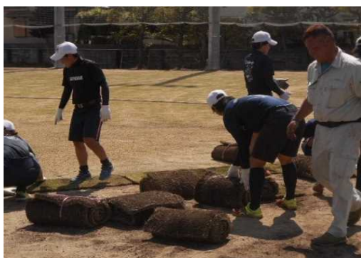
<整備中>ソフトボール部員による芝張り