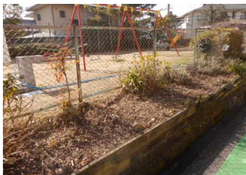
<整備前>花壇に雑草が繁茂