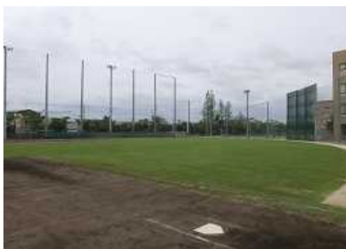
<整備後>芝生化されたグラウンド(尼崎市)