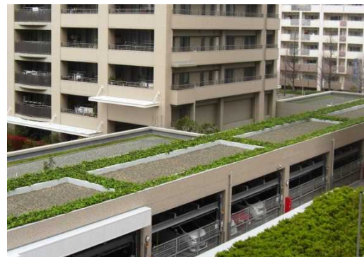
マンション駐車場の屋上緑化(神戸市)