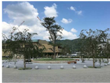
里山よりトビハシナガクを移植 (川西市)