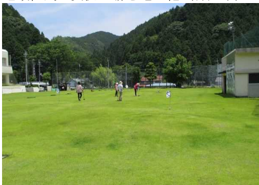
旧小学校のグラウンドを芝生化(多可町)