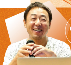
リノベリング / ワークビジョンズ (佐賀市・東京都)