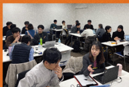
個別ワークの風景