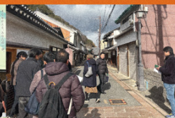
まち歩きの様子 (たつの市龍野地区)