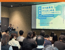
公開プレゼンテーション