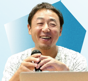
リノベリング / ワークヴィジョンズ (佐賀市・東京都)