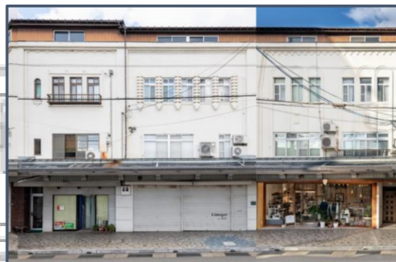
③佐藤家及び西村家住宅 （国登録有形文化財） RC造で3戸一体の店舗併用住宅長屋。異なる間口幅や幾何学的装飾が特徴的。