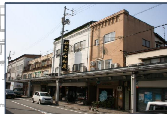
⑦河見家住宅 RC造3階建の店舗併用の長屋住宅で、当初の陸屋根の外観が残る。