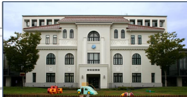
①旧豊岡町役場庁舎 （国登録有形文化財） 昭和2年度にRC造2階建の豊岡町役場として建設され、その後3階部分の増築、平成23年度に保存活動により曳家で移動。現在は議場・交流センターとして活用され、震災復興のシンボルとして親しまれている。

豊岡中心部では北但大震災（1925年（大正14年））からの復興期に建築された鉄筋コンクリート造（RC造）建築物や木造防火建築物の多くがまちなみとして残っており、北但大震災の2年前に発災した関東大震災後の復興遺産の多くが消失したことを踏まえると、希少性が高く、震災からの復興を今でもよく伝える重要な遺産である。