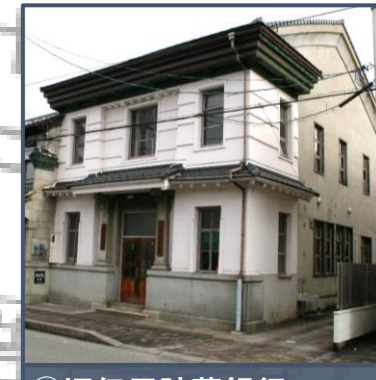
⑧旧但馬貯蓄銀行 和洋折衷の装飾的な特徴を持ち、軒裏は漆喰塗りの銅板張り、隣家との間には袖うだつを設けた木造防火建築。