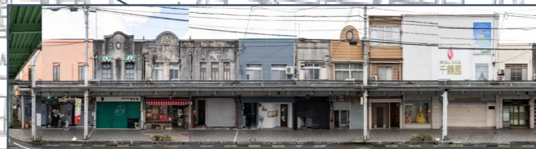
⑤大開通南側長屋 復興期に建築された最も大きな長屋で、大開通りに面する部分をRC造とすることで、都市の防火帯として機能している。また、一部に残るモルタル塗りの外観は建設当初の面影と時代の経過を感じさせる景観となっている。