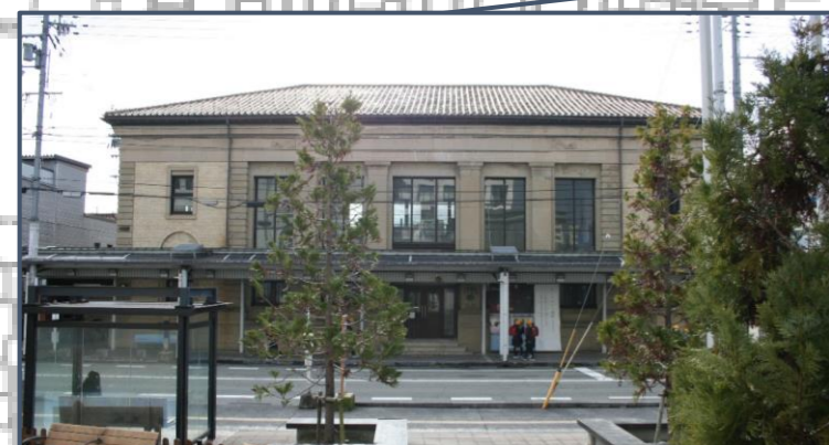
②旧兵庫縣農工銀行豊岡支店 （国登録有形文化財） 昭和9年にRC造2階建の銀行として建築され、意匠的に優れた復興建築。現在はホテルとして運営。