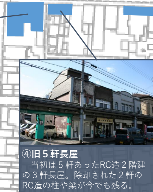
④旧5軒長屋 当初は5軒あったRC造2階建の3軒長屋。除却された2軒のRC造の柱や梁が今でも残る。