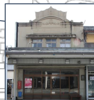
⑥鈴木家住宅 大開通り南側で唯一の戸建RC造。王冠装飾が特徴的。