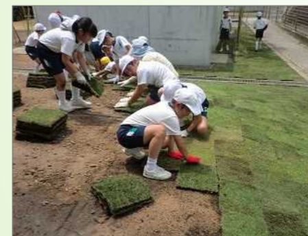
小学校の生徒たちによる芝張り