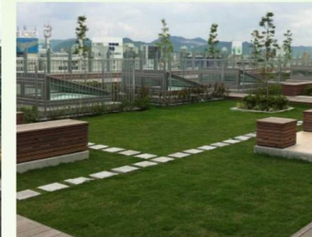
建築物の屋上緑化