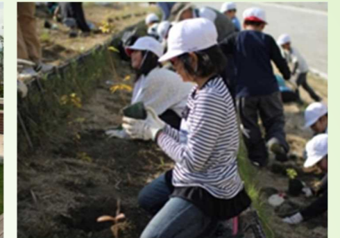
尼崎の森中央緑地での育成苗木の植樹