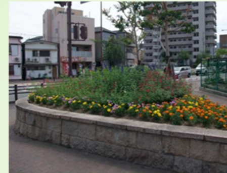
緑化資材の提供事業を利用して整備された花壇

ひょうご花緑創造プランでは、県民のゆたかな暮らしの実現に寄与するため、県民・団体・事業者・行政との参画と協働による花と緑の取り組みの方向性を示します。