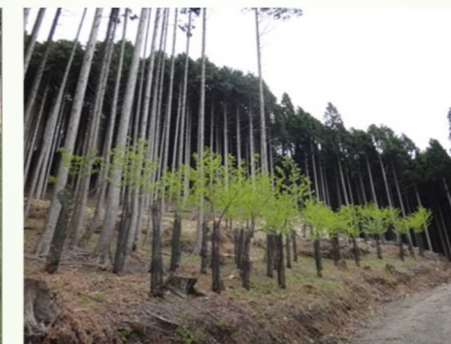
針葉樹林と広葉樹林の混交整備