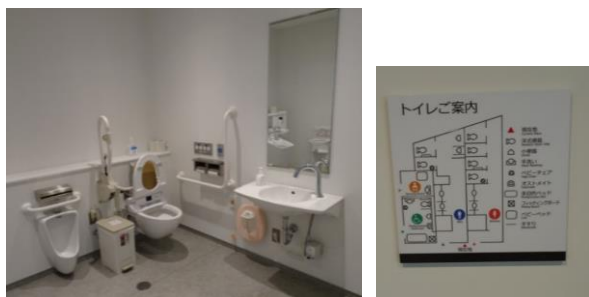
設備が整っている多機能トイレと入口の案内