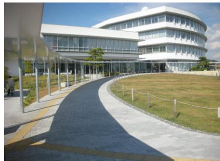
バス停からの通路に屋根を設置