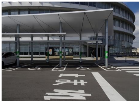
屋根のある車椅子利用者利用駐車場