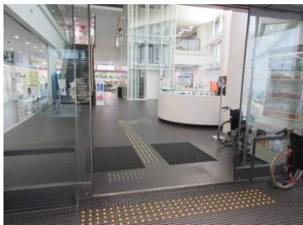
入口近くの案内所では来庁者に声かけ