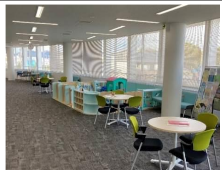
窓口の近くにキッズスペースを設置