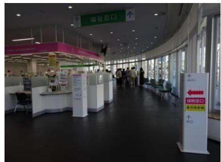
各所に設けられた誘導サイン