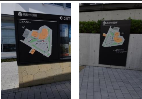
分かりやすくデザインが統一された案内表示