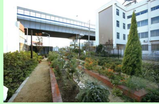
花壇として整備 (神戸市東灘区御影町)