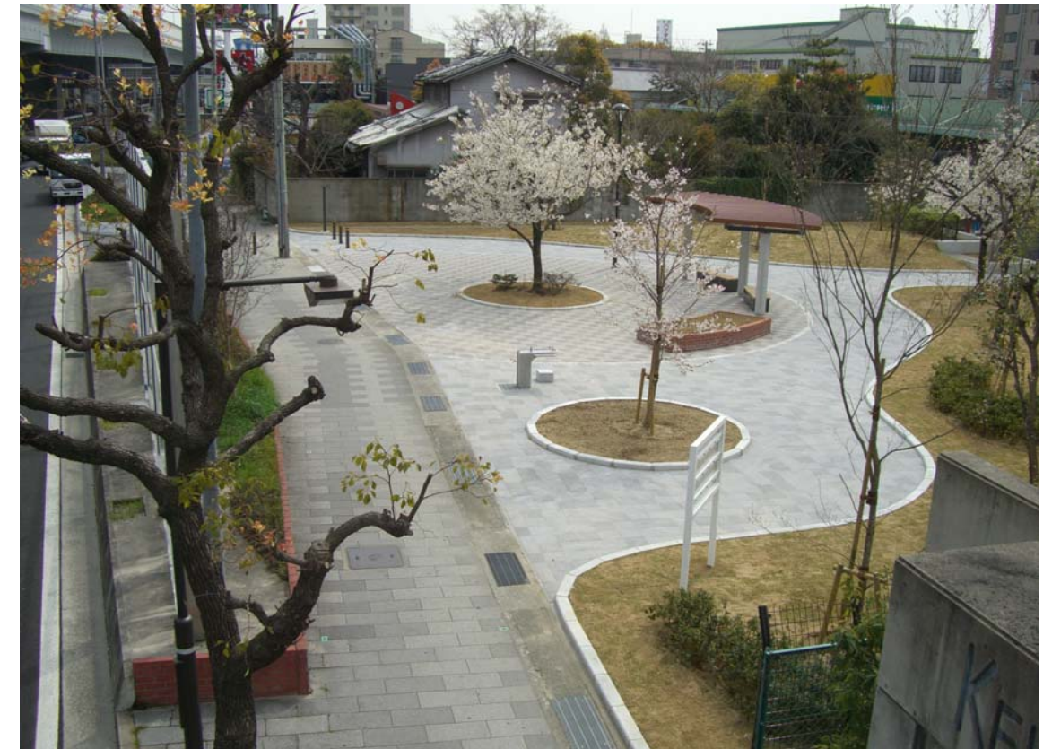
環境防災緑地「利用型」：広場として整備 (西宮市宮前町)