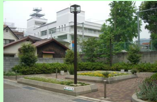
花壇等、広場として整備 (芦屋市精道町)

利用型は、住民のみなさんの要望を反映した整備を行い、沿道市及び地域の団体のみなさんが管理をしています。