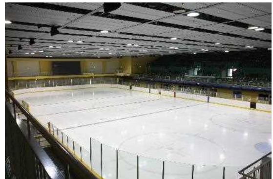
アイススケートリンク