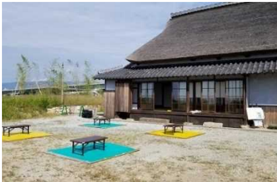
かやぶき民家（外観）