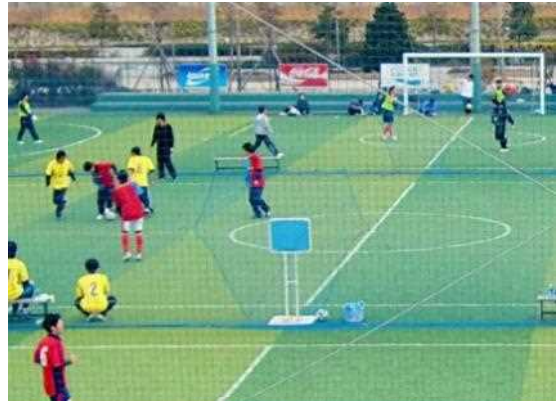
フットサルコート