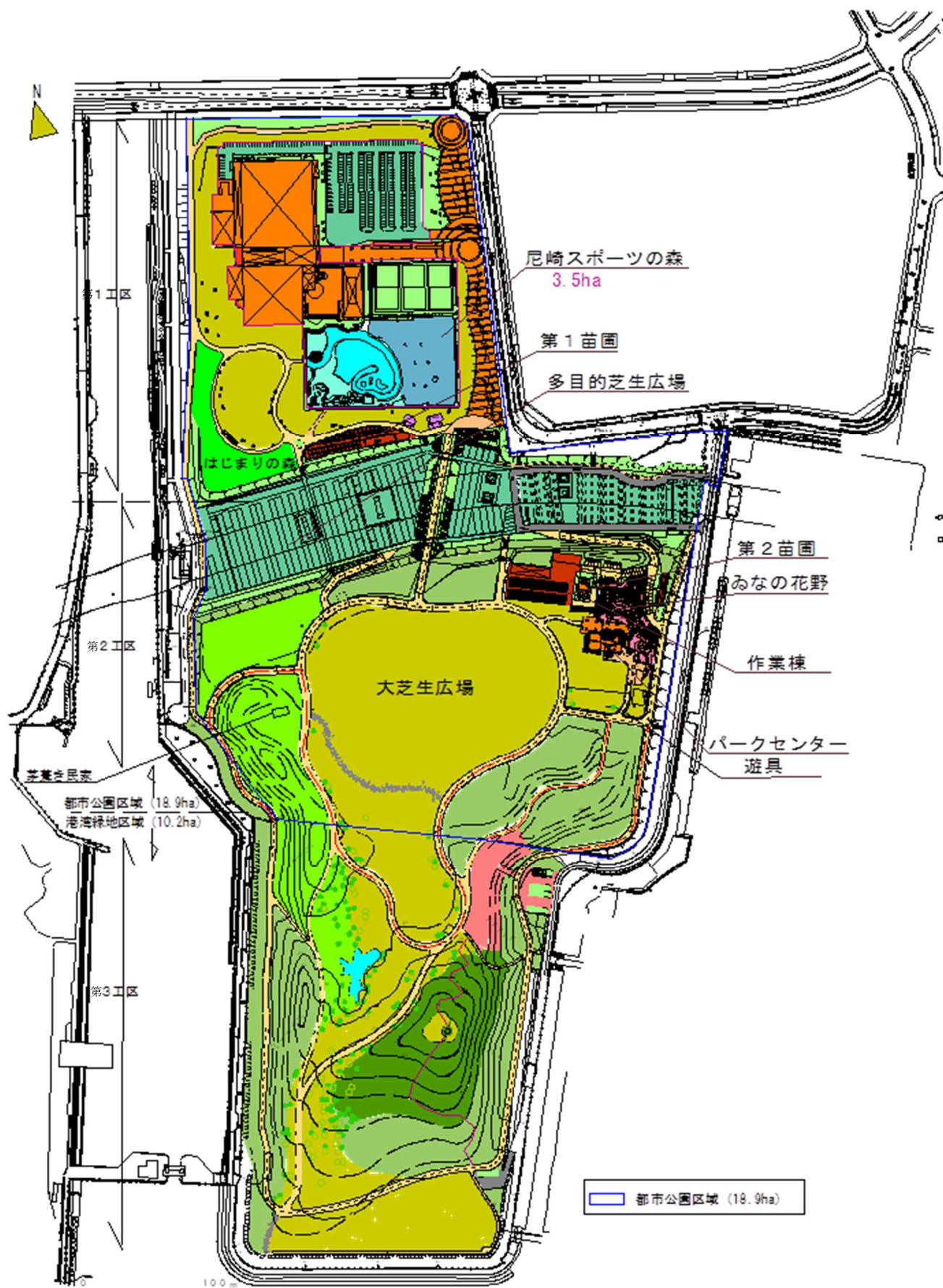
【別紙5-3】尼崎の森中央緑地 平面図