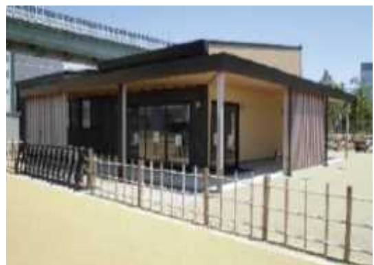
作業棟（環境学習棟）